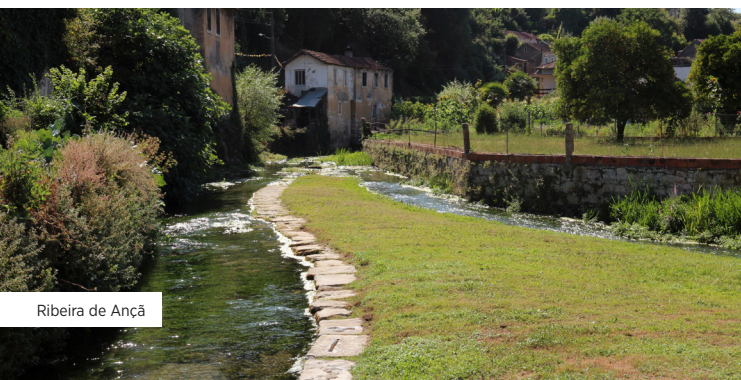
Ribeira de Ançã

Flore 1 Pins parasols Pinus pinea 2 Chêne des garrigues Quercus coccifera subsp. coccifera 3 Ciste Cistus ladanifer subsp. ladanifer 4 Ciste à feuilles de sauge Cistus salvifolius 5 Filaire à feuille étroite Phillyrea angustifolia 6 Nerprun alaterne Rhamnus alaternus 7 Ciste cotonneux Cistus albidus 8 Aulne Alnus glutinosa 9 Aubépines Crataegus monogyna