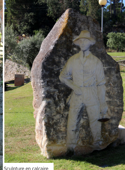
Sculpture en calcaire