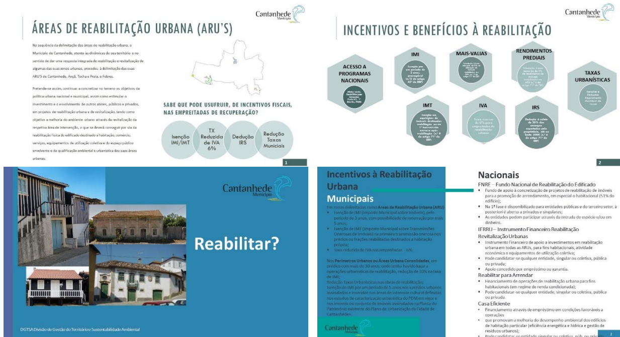
Figura 2. Folhetos de divulgação das ARU aprovadas no concelho de Cantanhede e dos incentivos à reabilitação urbana

Assim, nesta fase foi dado especial enfoque ao incentivo e apoio aos proprietários para a promoção da reabilitação dos seus edifícios. Ao longo dos três primeiros anos de execução da ORU foi prioritário proceder à divulgação e promoção das condições e vantagens subjacentes à reabilitação dos edifícios, sensibilizando-os para a manutenção da qualidade urbanística da cidade e eliminação de dissonâncias.